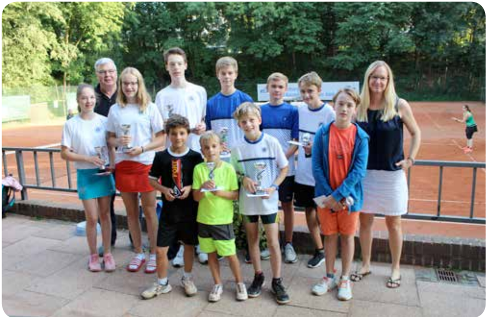
Alle Sieger mit dem Jugendteam.