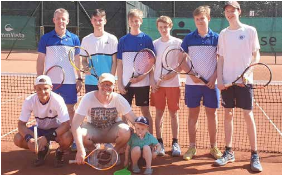
Unsere 1. Herren bei Grün-Weiß Stadtwald.