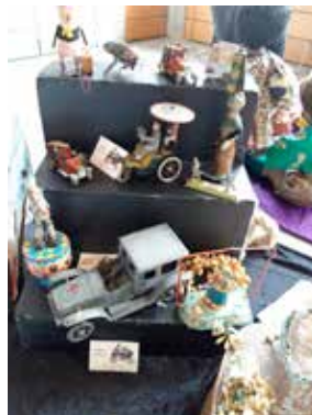
Spielzeug um die Jahrhundertwende.