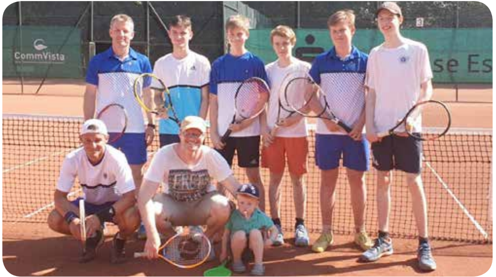
Unsere 1. Herren bei Grün-Weiß Stadtwald.