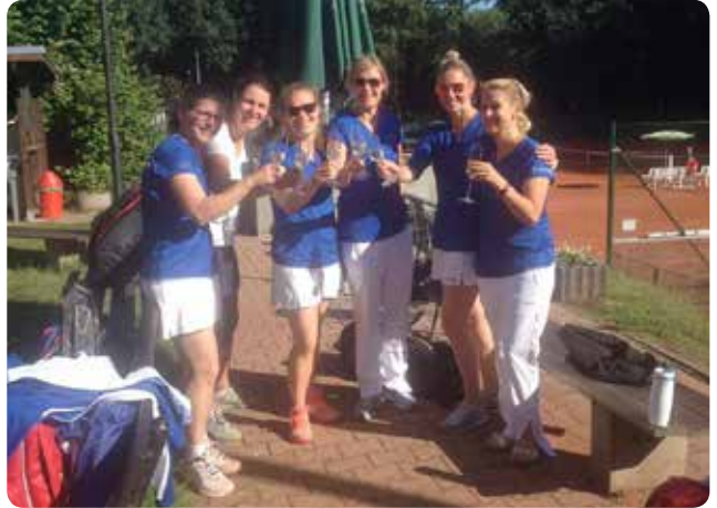
Unser morgendliches Zauberwasser.

Wir hatten wieder wirklich sehr nette Gegner und freuen uns auf ein Wiedersehen, bei dem wir dann aber den einen